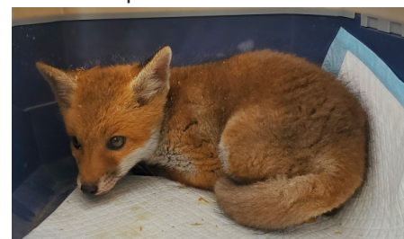
Ci-dessus, un renardeau cherché par la brigade verte à Wittisheim.

A Wittisheim, la brigade verte vient chercher les animaux blessés, il suffit de leur téléphoner : 03 89 74 84 04.