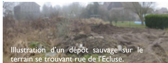
Illustration d'un dépôt sauvage sur le terrain se trouvant rue de l'Ecluse.

L'article 15 du Nouveau Code Pénal stipule que « tout dépôt sauvage d'ordures ou de débris de quelque nature que ce soit, ainsi que toute décharge brute d'ordures ménagères sont interdits ».